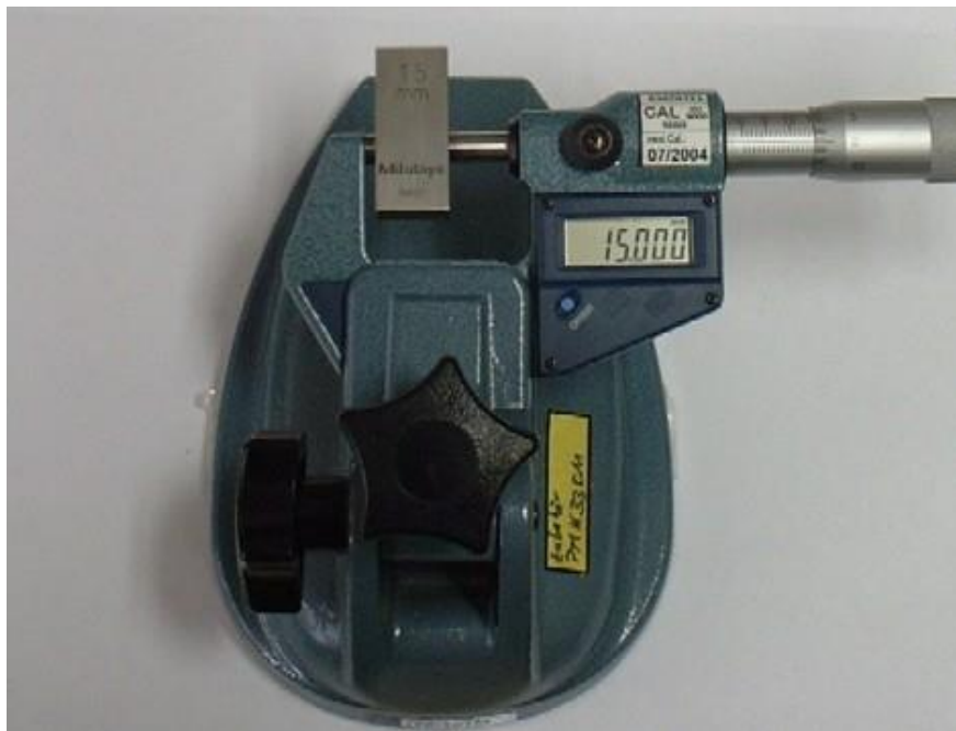
Bild L.V.1 Kalibrierung einer Bügelmessschraube

Die Kennwertermittlung wird auch mit einem planparallelen Glasprüfmaßsatz (Parallelität und Ebenheit der Messflächen) durchgeführt. Die Anzeige des Anfangswertes des Messbereichs wird geprüft und ggf. korrigiert.